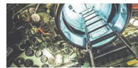
Ubåten Nordkaparen är ett av många fartyg som man får kliva ombord på.

Fartygs- och upplevelsemuseet Maritiman vid Packhuskajen öppnar igen den 1 maj.